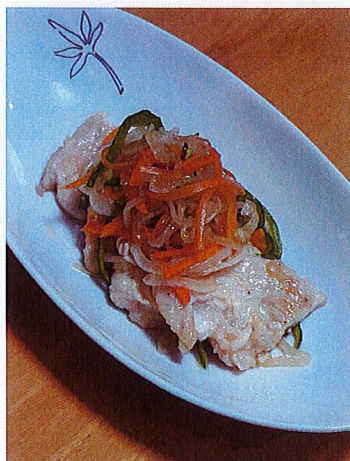
鶏のむね肉の南蛮漬け