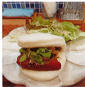
台湾トンポーロバーガー