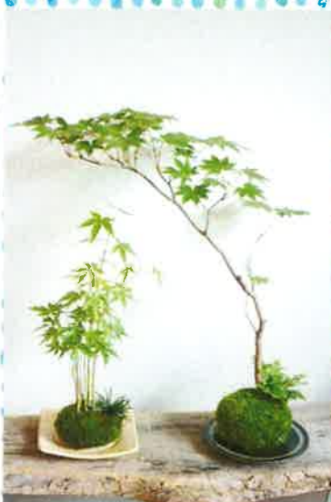
●画像はイメージです